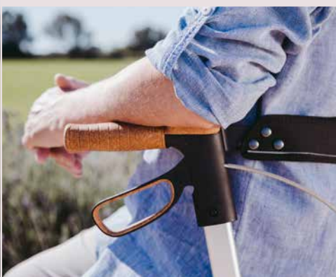
Armauflage aus Kork-TPE

Anti-Rutsch-Pads erleichtern das Ankippen des Rollators